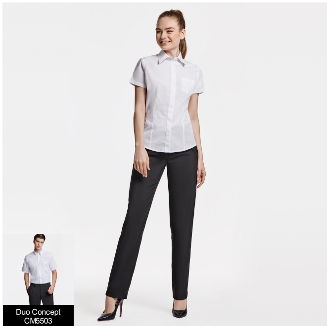
Duo Concept CM5503