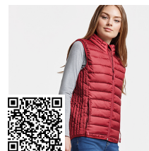
OSLO WOMAN RA5093