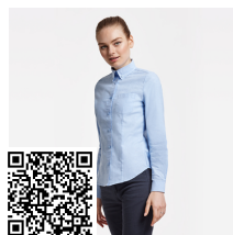
OXFORD WOMAN CM5068