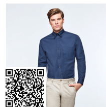
AIFOS L/S CM5504