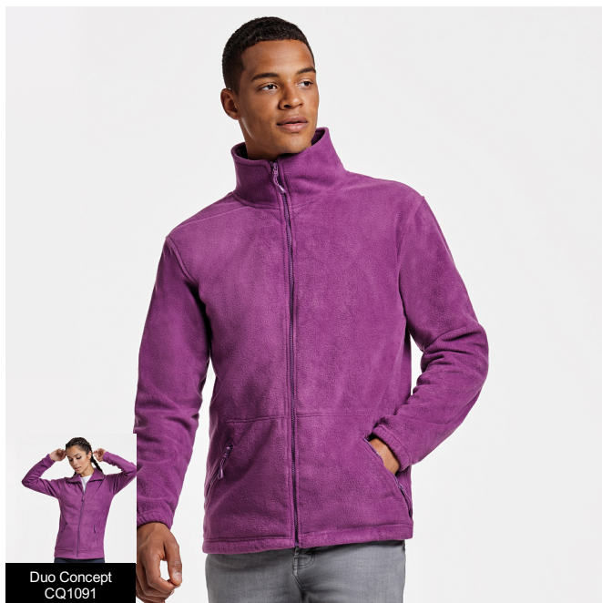
Duo Concept CQ1091