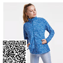
ARTIC WOMAN CQ6413