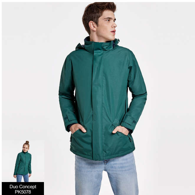
Duo Concept PK5078