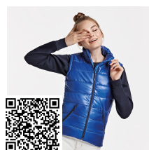
MONTANA WOMAN RA5084