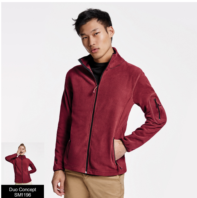
Duo Concept SM1195