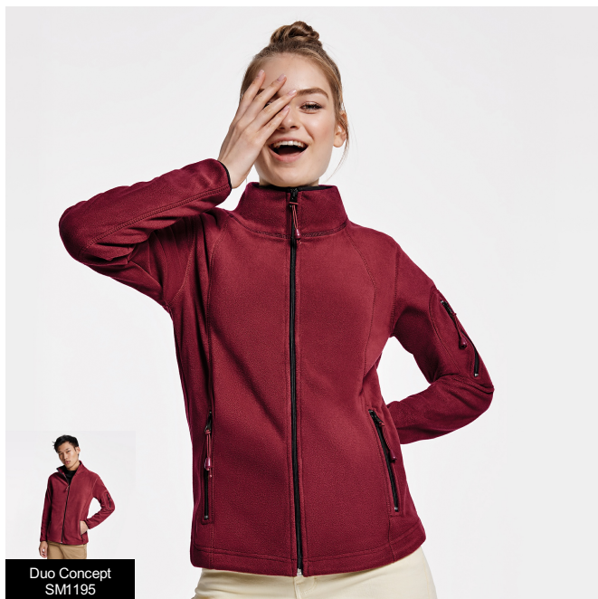
Duo Concept SM1195