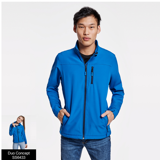
Duo Concept SS6433