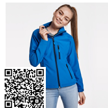
ANTARTIDA WOMAN SS6433