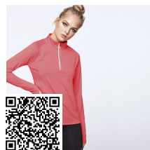
MELBOURNE WOMAN CA1114