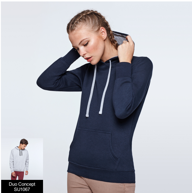
Duo Concept SU1067