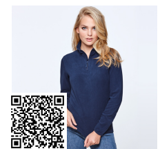
HIMALAYA WOMAN SM1096